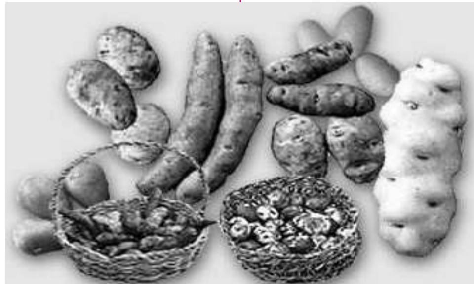
La papa: el gran aporte a la alimentación mundial de los pueblos originarios andinos

Es gratificante que la revista digital peruana Boletín de New York difunda el valioso patrimonio de la milenaria sociedad Andina y que es, también, patrimonio de la humanidad. Una de las formas para conservarlo, es justamente que se conozca a través de un medio como esta revista digital, permitiendo a sus lectores informarse correctamente sobre la importancia que significa observar y proteger el legado de nuestros ancestros. Entre lo mucho que nos queda por hacer juntos, envío desde Los Andes un fraternal saludo a sus lectores y agradecer a su editor Luis A. Ramírez por divulgar las virtudes y conocimientos desarrollados por la civilización Andina.