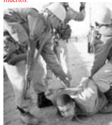
Soldados norteamericanos en Irak

La invasión de las tropas de los Estados Unidos a Irak, iniciada en 2003, puede haber victimado en torno de 655 mil personas. El dato fue divulgado recientemente por la revista británica «The Lancet» y es resultado de una investigación realizada este año por médicos iraquíes según los criterios de la Facultad de Bloomberg de Salud Pública, de la Universidad de Johns Hopkins (EUA). El total de muertos corresponde a 2,5 % de la población del país. Según el análisis, el terror causado por la invasión a Irak trae también otros perjuicios a la población que escapa de los ataques. Es que los bombardeos comprometen los servicios como distribución de agua potable y luz, además del acceso a los servicios de salud y los problemas de alimentación y falta de empleo. La investigación fue realizada con base en estadísticas y entrevistas en hogares iraquíes, constatando que el índice de mortalidad en el país pasó de 5,5 para 13,3 para cada mil personas después del comienzo de la guerra. Sin embargo, el gobierno estadounidense informa un número mucho menor. En un discurso en 2005, el presidente George W. Bush afirmó que la guerra protagonizada por los Estados Unidos había dejado sólo 30 mil muertos.