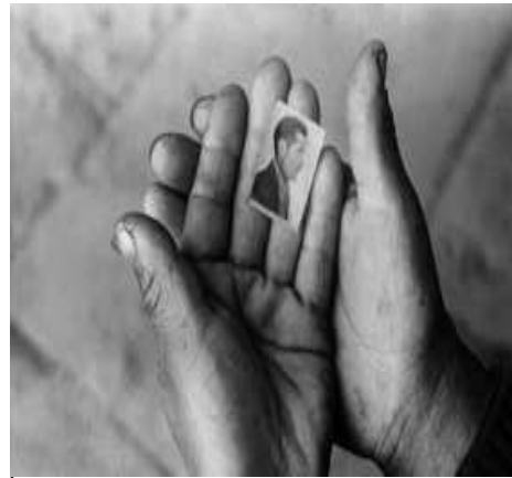
NI OLVIDO NI PERDÓN

"Los familiares de las víctimas de la violencia creemos que solo la sanción a los responsables contribuirá a dignificar la memoria de nuestros seres queridos. Como familiar del caso La Cantuta exigimos y demandamos a las autoridades a mantener una actitud firme en torno al proceso de extradición de Alberto Fujimori, quien debe ser juzgado y sancionado por la justicia peruana conforme a su responsabilidad en los crímenes que se le imputan".