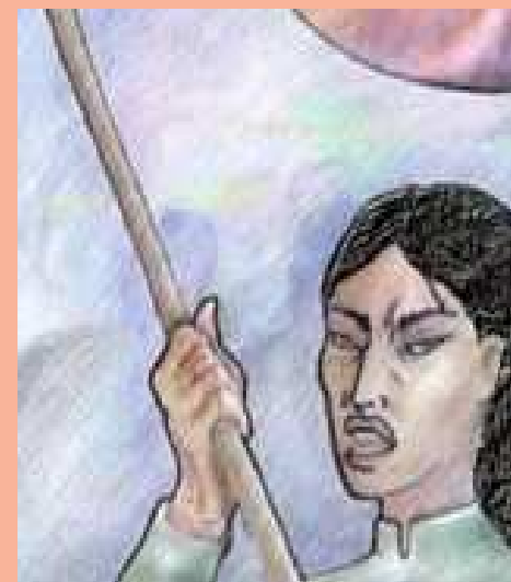
Bartolina Sisa ejemplo de valor y coraje

A Bartolina Sisa la derroto la traición de sus propios compañeros, quienes la capturan y entregaron a Sebastián Segurola, la sentencian el 5 de setiembre al mismo tiempo que a Gregoria Apaza, son arrastradas desnudas, con corona de espinas, atadas a las colas de los caballos, le mutilan los pechos, le cortan la lengua, es ahorcada y descuartizada. Murió luchadora, murió digna nos dejó la prueba de que la valentía y la entrega están en nuestras mujeres, en nuestro pueblo, nos dejó el ejemplo y la esperanza.