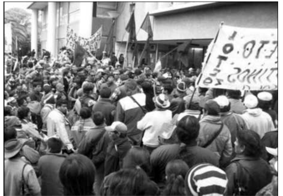
Asonadas militares, rebeliones y levantamientos populares han sido la constante en 500 años de lucha de los pueblos originarios contra los invasores y sus aliados

Hicieron huelga de hambre exigiendo su libertad, por la huelga murieron dos. Luego de esas muertes les liberaron, no levantaron la huelga hasta llegar a sus domicilios.