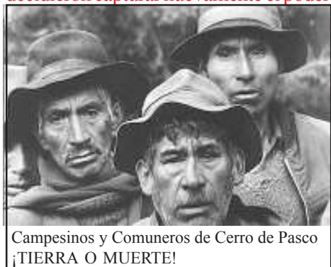
Campesinos y Comuneros de Cerro de Pasco ¡TIERRA O MUERTE!

Luego el campesinado indígena de varias zonas del país inició la toma de tierras que fue respondida a balazos por el gobierno civil, pero ni las balas detuvieron las tomas, entonces los militares decidieron capturar nuevamente el poder