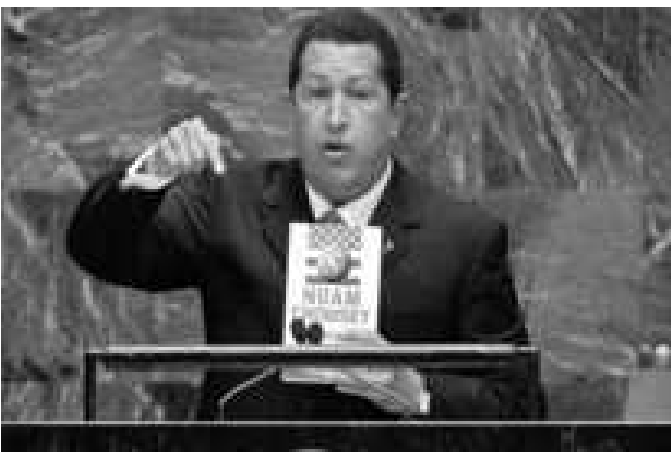
Chávez en la ONU

Terminó pidiendo que la sede de las Naciones Unidas salga de Estados Unidos.