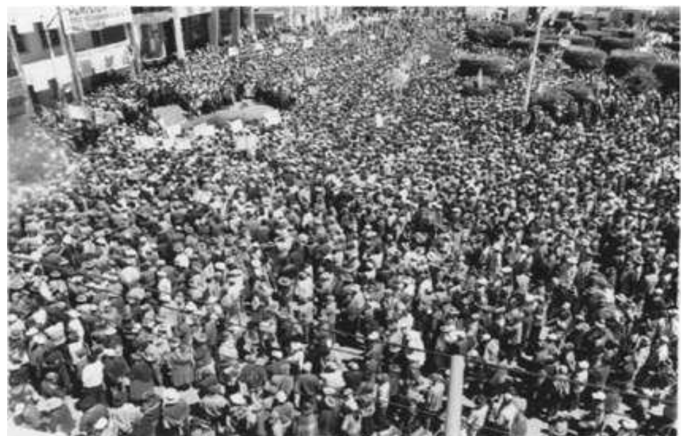
ILAVE: Movimiento de masas indígenas, visiblemente presente en la lucha

Ahora, un grupo, con mayoría de cusqueños, que editamos mensualmente «Lucha Indígena» vemos la dinámica del movimiento indígena peruano, continental y mundial, comprendemos su importancia para la construcción de otro Perú dentro del otro mundo posible por el cual luchamos. Nos esforzamos por contribuir con hacer conocer esa dinámica en nuestro país, colaborar en su extensión, su continuidad, su coordinación, etc. Estamos en el número 7 del periódico, no sabemos cuántos números más saldrán pues tenemos dificultades económicas, no recibimos dinero de ninguna ONG, hay compañer@s que comprendiendo eso nos ayudan económicamente. Solicitamos el apoyo, fundamentalmente económico y con la difusión del mensuario, de quienes consideren que el trabajo que realizamos es positivo.