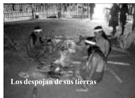
Los despojan de sus tierras

El Instituto de Recursos Naturales (INRENA) da concesiones ilegales de tierras a ONG's extranjeras sin el consentimiento de sus propietarios originales. En este caso se trata de una concesión de más de 62.000 has. que el INRENA está dando a la ONG ACCA que es la cara peruana de ACA (Amazon Conservation Agency) con sede en Washington. Estas tierras están en la zona de selva de la Nación Q'eros en donde ellos siembran maíz y en donde existe una gran biodiversidad, agua pura, oro y centros arqueológicos que los Q'eros han mantenido en secreto para su protección. Esta ONG ACCA tiene además una concesión de más de 100.000 has. en el Río Los Amigos (Madre de Dios) y también intentaron comprarle a la comunidad de Sunchubamba (cuenca del Río Mapacho) una extensa franja de tierras en las laderas que miran hacia el Parque Nacional Manu pero la comunidad de Sunchubamba se opuso terminantemente a esto cuando se enteró de que su presidente estaba haciendo estos tratos sin el conocimiento de los comuneros.