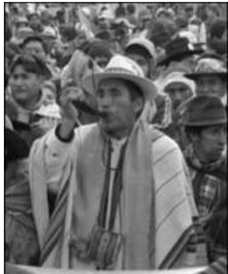
Movimineto vivo que la “izquierda” racista no ve

Lo vimos claramente en Ecuador, cuando los dirigentes de “izquierda” no aceptaron que los indígenas encabezaran la lista electoral, y ahora cada uno va por su lado. Lo vimos en el mismo